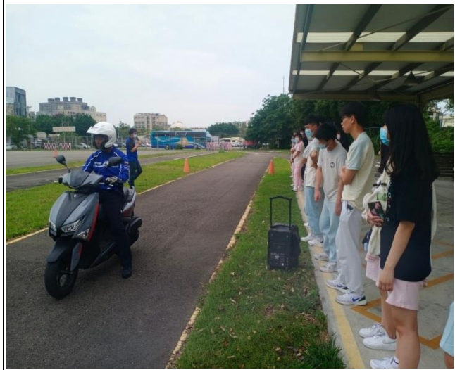
安全距離換算及煞車的技巧