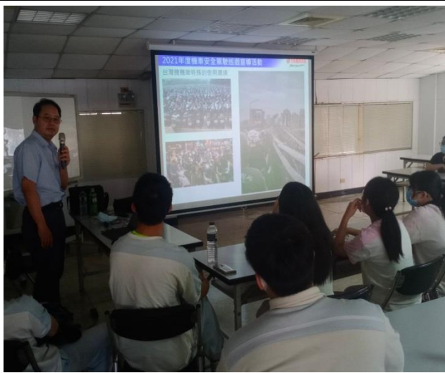
台灣擁有世界第一的機車擁有率(3.5/家)