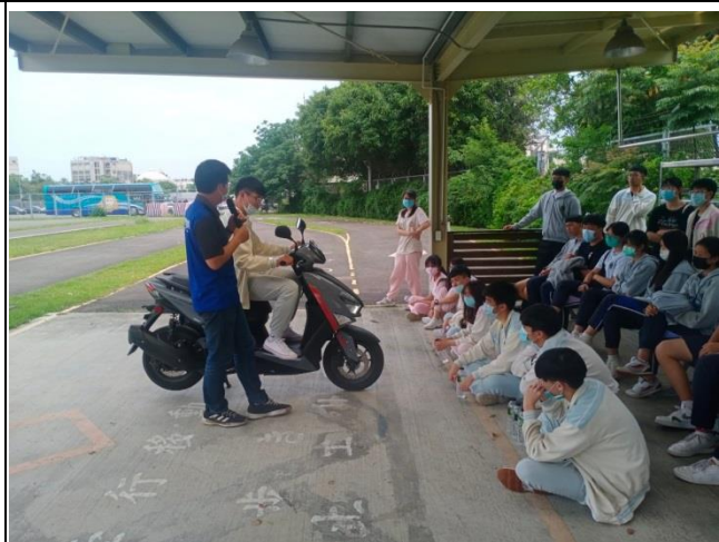
介紹機車的外觀及保養