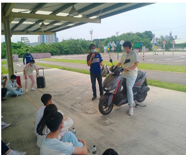
介紹油門與煞車的操作要領