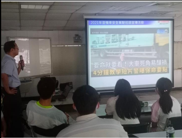
大客車的死角及內輪差