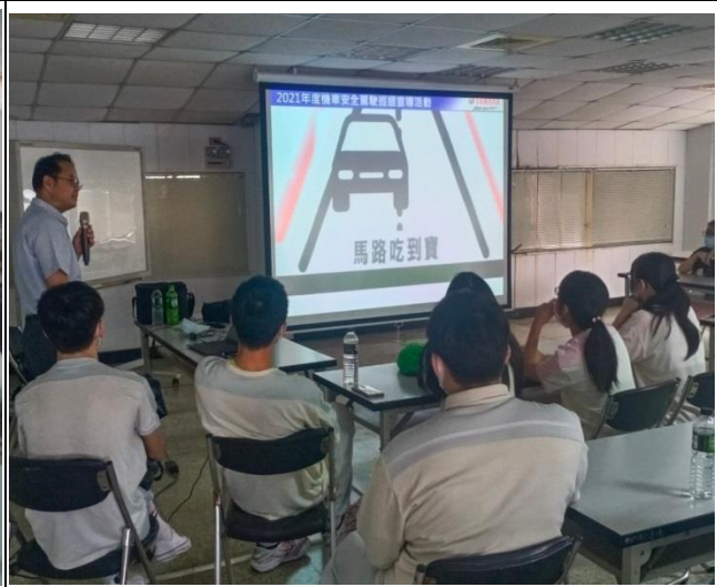
馬路三寶肇事原因分析